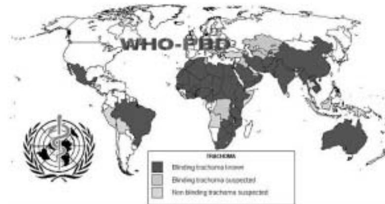
Figure 2. The global distribution of blinding trachoma ( www.who.int/pbd/trachoma/MAPS.htm )

Recent World Health Organisation (WHO) estimates hold trachoma accountable for some 5.9 million blind, 15% of the world's blindness (Thylefors, 1995). A further 10 million are estimated to have trichomatous trichiasis, and are therefore considered to be in immediate danger of going blind from resultant