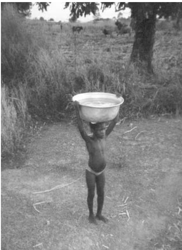
Figure 3. Water availability impacts directly on levels of trachoma

Cost benefit analysis of surgical intervention to prevent blindness from trachoma has shown that