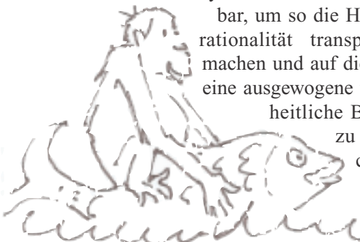
Cartoons: Maria Sauheitt

Analyse der Umstände unabdingbar, um so die Handlungs-rationalität transparent zu machen und auf dieser Basis eine ausgewogene und ganzheitliche Bewertung zu ermöglichen.