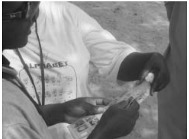
A blind voter being shown how to use the tactile ballot guide in Ghana

In Francophone West Africa, the Committee for Democratic Observance was established by DPOs to lobby for the greater inclusion and participation of disabled people in the 2005