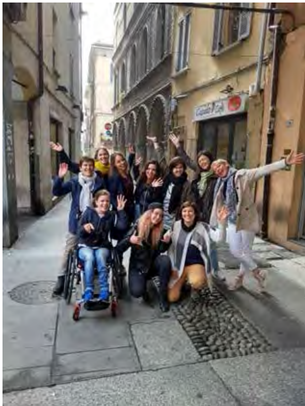
Transnational Meeting of Partners in Pavia, Italy, May 2019

Auch wenn die Europäische Kommission sehr schnell nach der Pilotphase des EFDs die Möglichkeit schuf, Kurzzeitfreiwilligendienste anzubieten, um benachteiligten Zielgruppen einen niedrighschwelligeren Zugang zum EFD/ESK zu verschaffen, so wurde und wird dieses Format wenig genutzt. Welche Gründe dieses hat, darüber kann nur spekuliert werden, da es diesbezüglich keine belastbaren Zahlen gibt – möglicherweise ist es das Image bei Jugendlichen, dass internationale Freiwilligendienste mindestens sechs Monate dauern müssen und v. a. Gymnasiasten vorbehalten sind (Becker/Thimmel 2019). Aber auch bei Trägern der Jugendarbeit herrschen diese Vorstellungen vor bzw. sind Kurzzeitformate kaum bekannt. Zudem besteht auf Anbieterebene das Problem, dass Kurzzeitformate gegenüber Langzeitformaten deutlich teurer sind. Die Umsetzung von Kurzzeitformaten bedeutet sowohl in der Vorbereitung als auch in der Nachbereitung den gleichen Aufwand wie bei Langzeitformaten. Somit ist das Angebot für Träger wenig attraktiv, wenngleich das Projekt Europa für alle zeigt, dass es für die Jugendlichen mit verschiedenen Zugangsbeeinträchtigungen einen idealen Einstieg in den Bereich der internationalen Jugendmobilitätsprojekte darstellt – insbesondere, wenn die Freiwilligen in