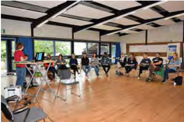
Exchanging between regional and local partners on projects and practices

Europa aus Pavia/Italien sowie der Technischen Hochschule Köln auf den Weg gemacht, um diesen Sachverhalt besser zu verstehen und Ansätze zu finden, wie es gelingen kann, einen vielfältigeren Kreis an Jugendlichen und entsprechenden Organisationen den Zugang zum Europäischen Freiwilligendienst (EFD)/Europäischen Solidaritätskorps (ESK) zu ermöglichen.